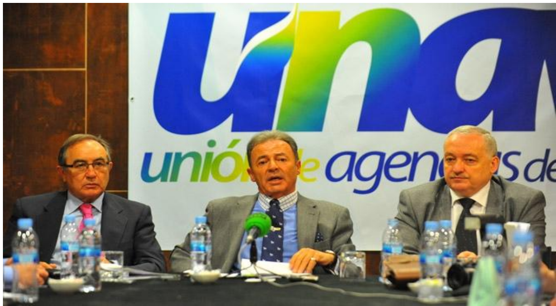
Presentación del Congreso Nacional de Turismo de la Unión de Agencias de Viajes (UNAV), el lunes en Madrid.

La Unión de Agencias de Viajes (UNAV) celebrará el 8 de mayo su XVII Congreso Nacional de Turismo, que debatirá sobre situación de la industria turística, con especial hincapié en el segmento de la distribución, bajo el lema 'Con rumbo a la rentabilidad'.