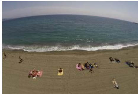
Vista aérea de varias personas tomando el sol ayer en la playa de La Malagueta en Málaga.

El sector turístico afronta con esperanza y optimismo la que podría ser la mejor Semana Santa desde el inicio de la crisis, un periodo vacacional que depende en gran medida de la demanda interna y que se va a convertir en el test para evaluar la recuperación del turismo nacional.