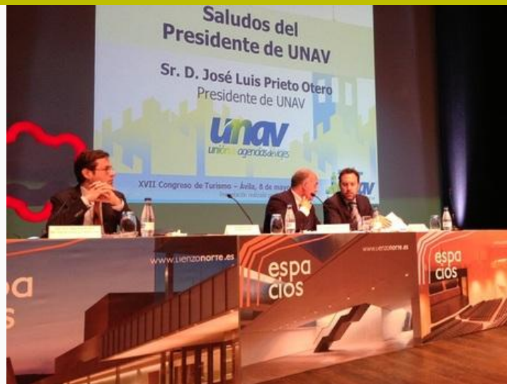
Inauguración del XVII Congreso de Turismo de la UNAV en el Lienzo Norte