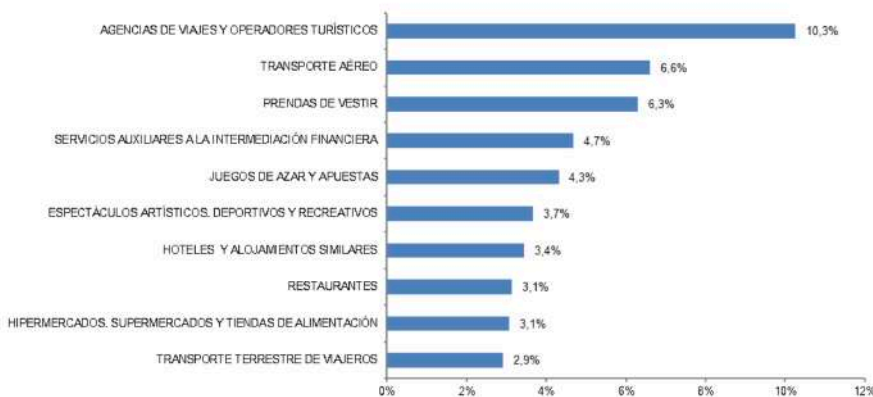
LAS DIEZ RAMAS DE ACTIVIDAD CON MAYOR PORCENTAJE DE VOLUMEN DE NEGOCIO DEL COMERCIO ELECTRÓNICO (I-24, porcentaje)

➔ La facturación del e-commerce en España aumenta en el primer trimestre un 13,7 % interanual hasta los 21.793 millones de euros, según los últimos datos disponibles en CNMCData